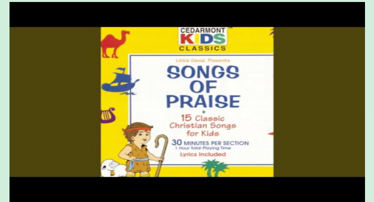
(유치부) God is so Good