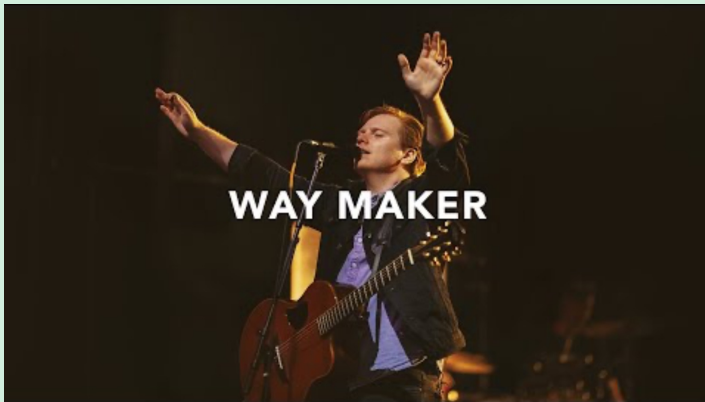
Way Maker (Leeland)

Way Maker (Leeland), Way maker (레위지파), (유치부) Sing for Joy new