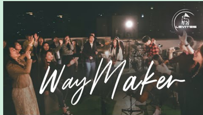
Way maker (레위지파)