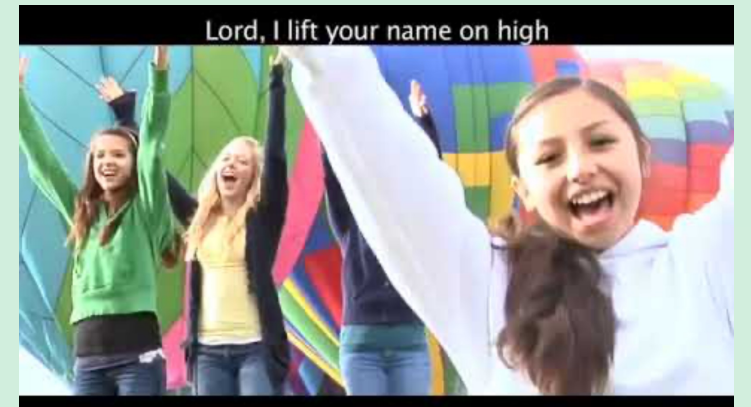
(유치부) Lord, I Lift Your Name on High