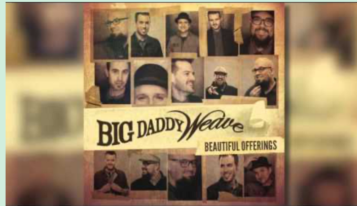
Lion and the Lamb (Big Daddy Weave)