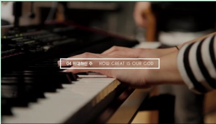
위대하신 주 (J-US)

위대하신 주 (J-US), How Great is Our God (Chris Tomlin), (유치부) 손을 높이 들고