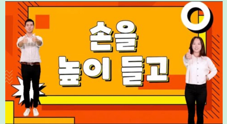
(유치부) 손을 높이 들고