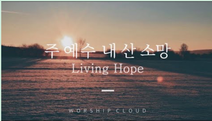
주 예수 내 산 소망 (워십클라우드)

주 예수 내 산 소망 (워십클라우드), Living Hope (Phil Wickham),(유치부) 나를 만나주세요