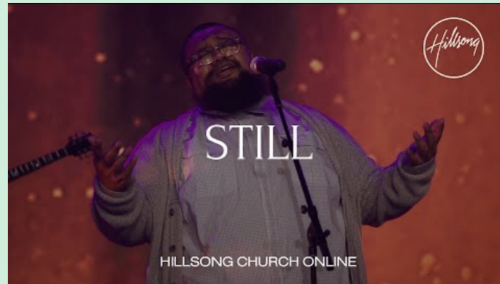
Still (Hillsong Worship)