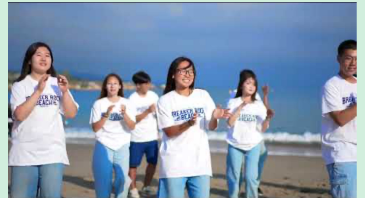
(유치부) Breaker Rock Beach