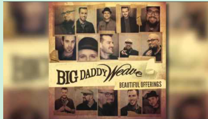
Lion and the Lamb (Big Daddy Weave)