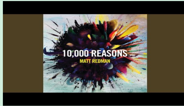
10,000 Reasons (Matt Redman)