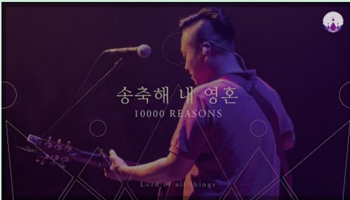
송축해 내 영혼 (예수전도단)