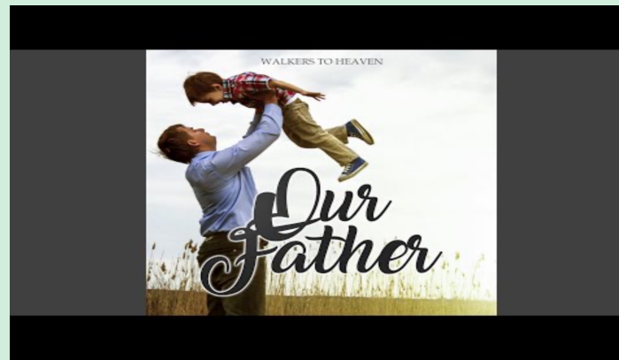
Blessed Assurance(Walkers to Heaven)