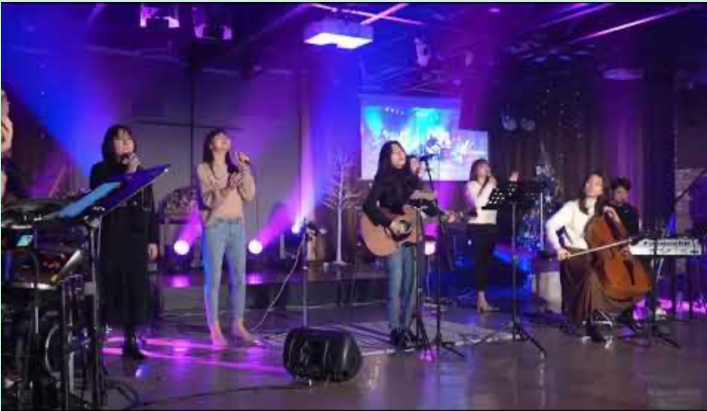
주 예수 나의 산소망 (레위지파)

주 예수 나의 산소망 (레위지파), Living Hope (Phil Wickham), (유치부)나를 만나주세요