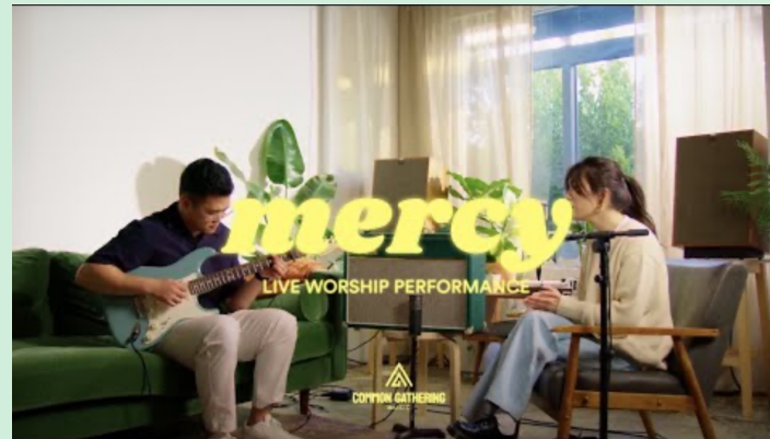
Mercy (Common Gathering)