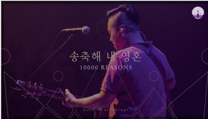
송축해 내 영혼