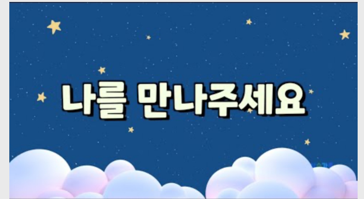
(유치부) 나를 만나주세요