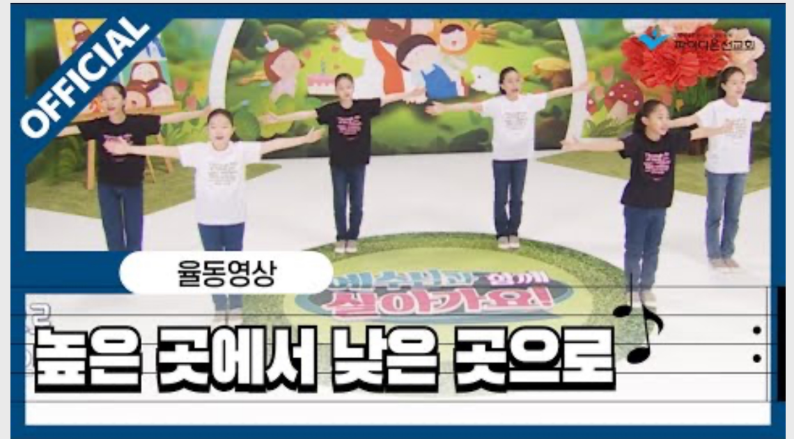
(어린이) 높은 곳에서 낮은 곳으로