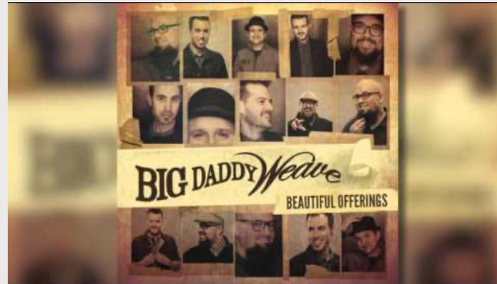
Lion and the Lamb