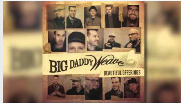
Lion and the Lamb