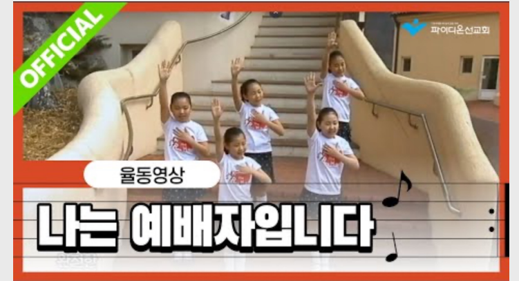
(유치부) 나는 예배자입니다