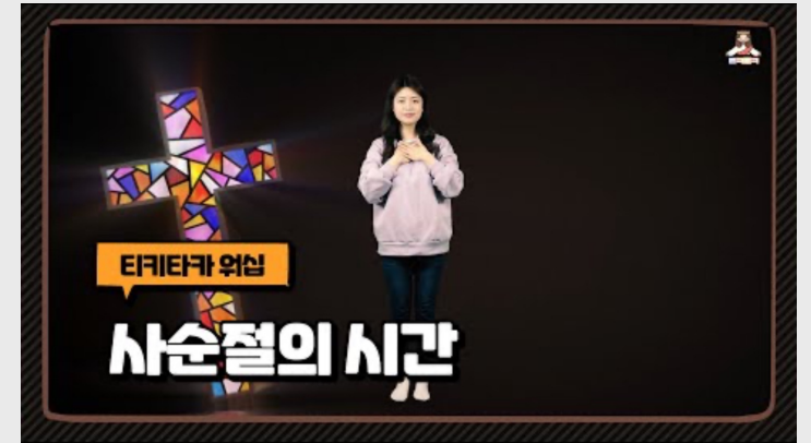
(유치부) 사순절의 시간