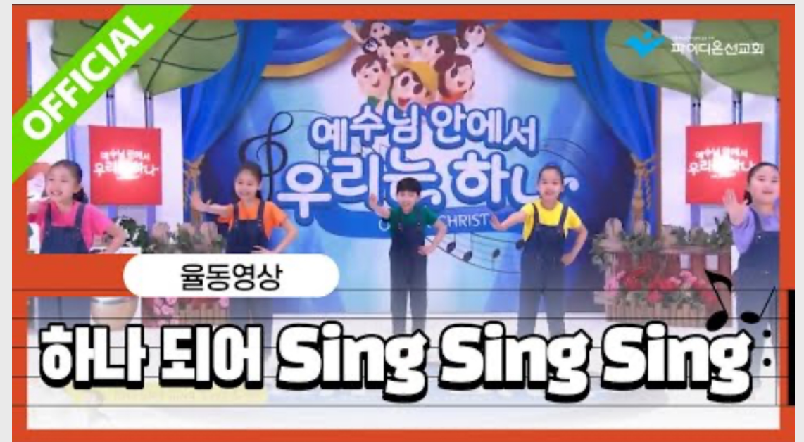
(어린이) 하나 되어 Sing Sing Sing