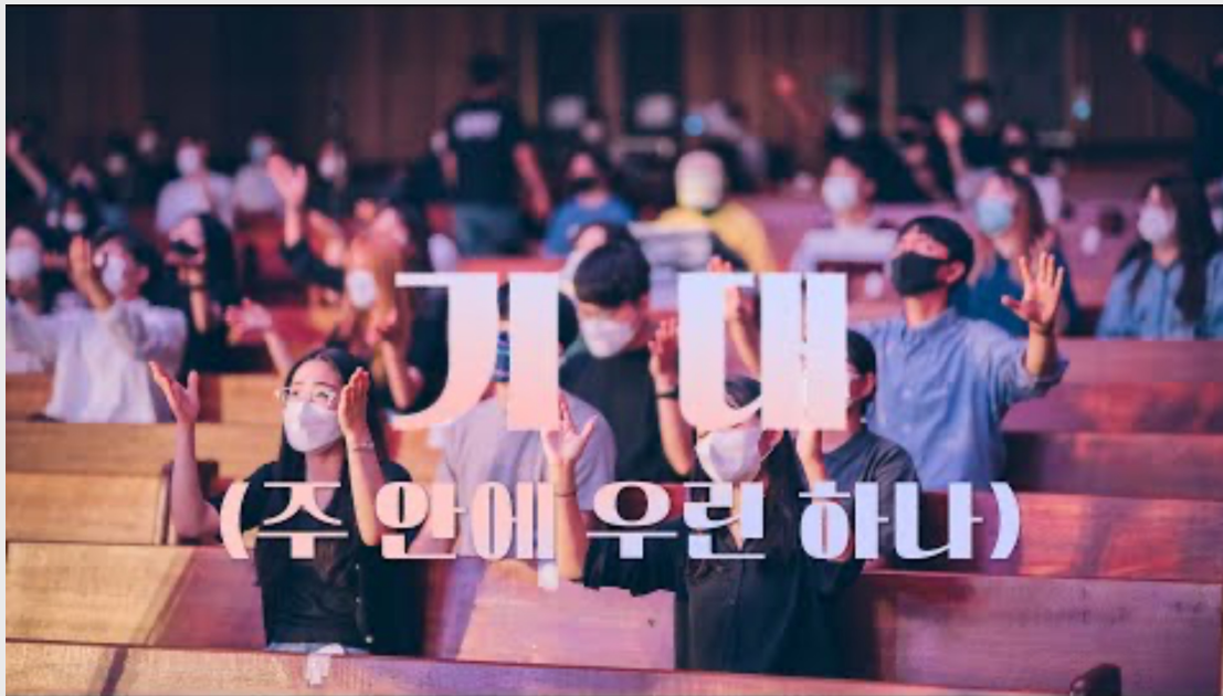
기대(주 안에 우린 하나)