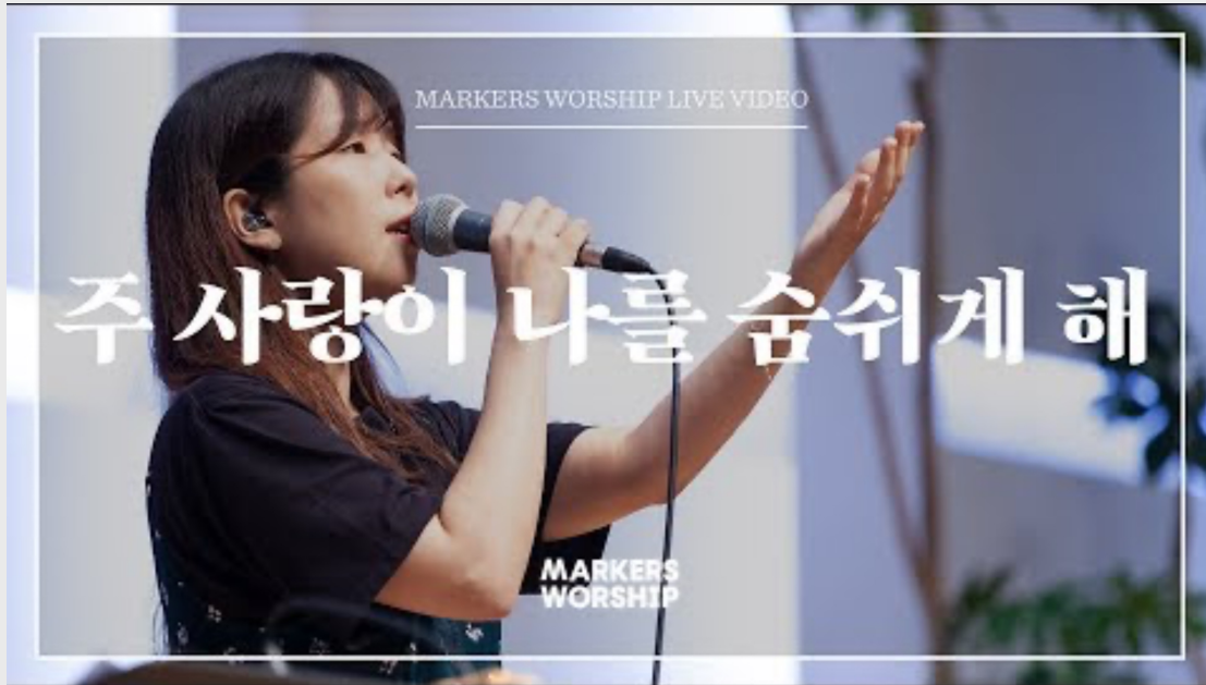
주 사랑이 나를 숨쉬게 해