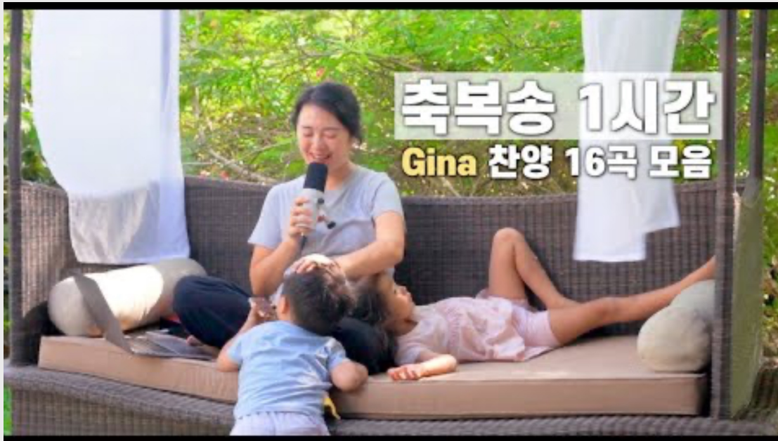
축복송 (아론의 축복)