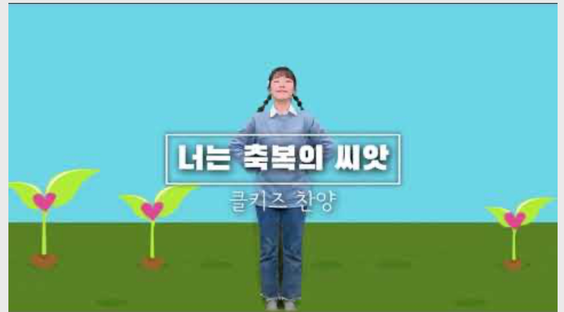
(어린이) 너는 축복의 씨앗