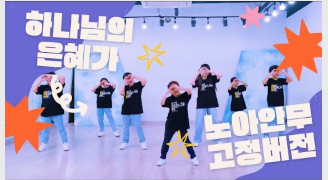
하나님의 은혜 (어린이)